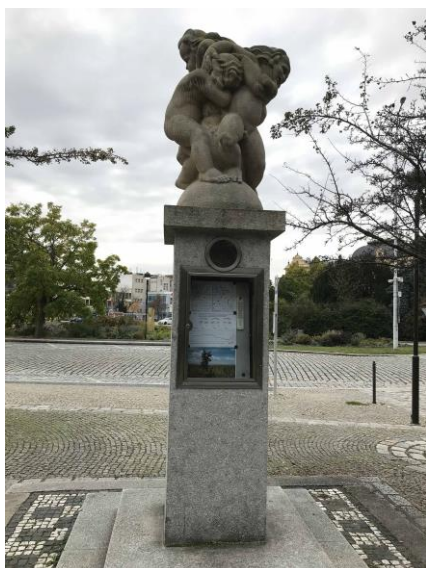
Meteorologický sloupek v Českých Budějovicích na Senovážném náměstí

zaznamenávají jedny z nejvyšších nárazů větru v kraji (např. v lednu roku 1994 v silném západním proudění hluboké tlakové níže nad Skandinávií byl zde maximální náraz větru 48,9 \text{ m/s} = 176 \text{ km/h} ).