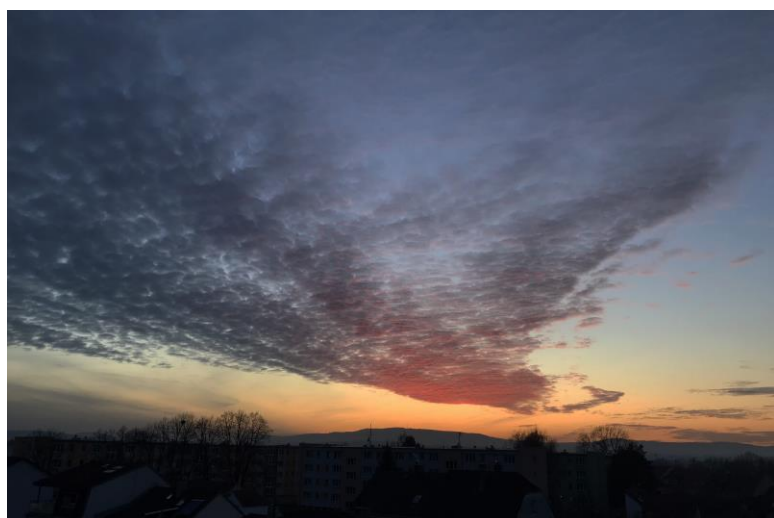
Alto cumulus nad ČB

6) Rekordní teploty v JČ: maximum 39,7 °C dne 27.7.1983 v Husinci a ve Vráži u Písku; celorepublikové minimum -42,2 °C dne 11.2.1929 v Litvínovicích u Č. B.